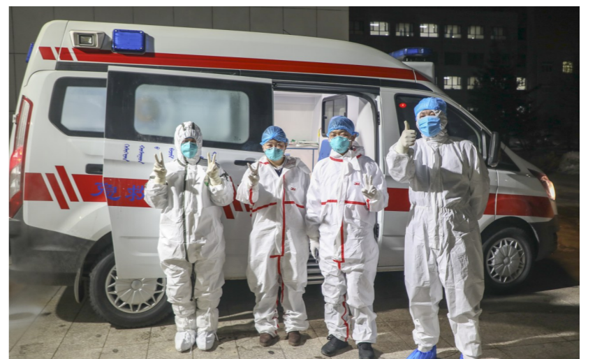
旗120中心采集咽拭子一线队伍整装出发