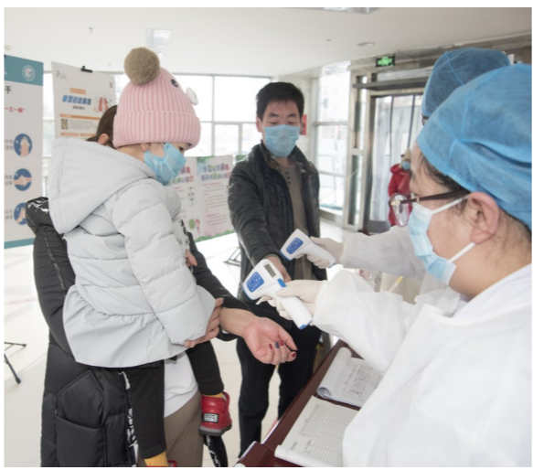
医务人员正在检测体温