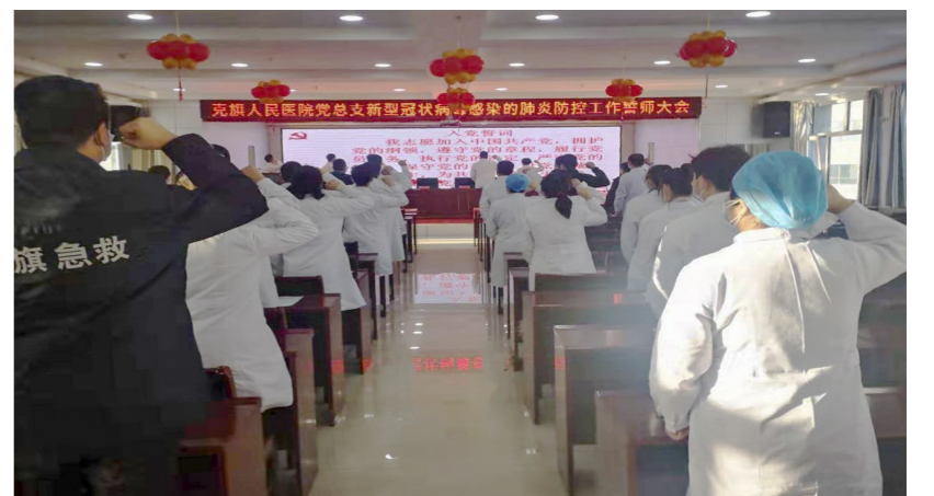
全体党员誓师大会