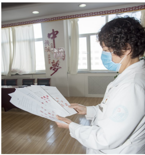
摁着鲜红手印的请战书