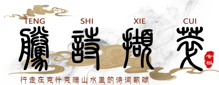
行走在克什克腾山水里的诗词歌赋

礼，乞求神灵保佑一家老小平安无恙。大殿内关老爷手擎大刀，慈眉善目不动声色，脚下香炉里香烟如云，佛灯长明，跪拜祈福，求财男女接踵而来。院内古榆参天，翘檐飞阁，雕梁画栋，栩栩鲜明，陀佛合十，口念佛号。施舍捐赠，虔诚的人们但求子孙安泰，福寿绵绵。