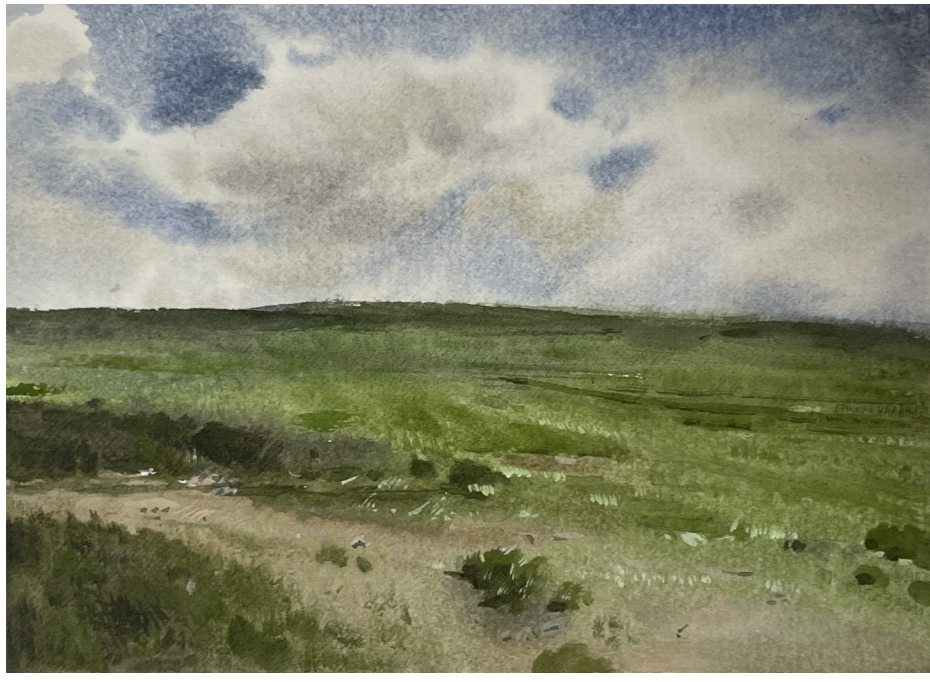
水彩画 漠北草原 毛禹

人烟稀少，是漠北高原的主要特征。诗人通过记录漠北的出行经历，把漠北草原的空旷辽远和善变的气候变化告诉世人，为出行漠北的人们提供了行动指南。