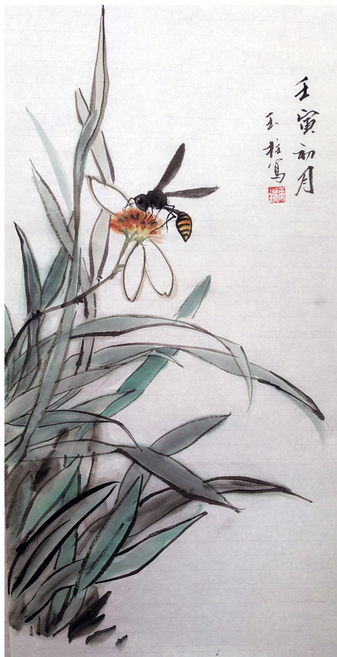
水墨画 果赢采蜜 张玉柱

诗人出巡兴安岭时，正是初秋时节，塞北草原因被秋霜打过，草已黄了大半，但仍有些绿意。兴安络纬虫在这黄绿相间的草色里悠闲爬动，可爱至极。诗人生活在皇宫里整天接受臣子、下人跪拜，面对朝臣的谏表、奏章，感觉压力山大，生活枯燥，而当他突然看到络纬虫、果赢、螟蛉，立刻来了兴致。他想把络纬的悠闲，留在记忆深处，提笔描画之余，感慨徐熙和黄筌这两位精于画虫的画家不曾来过兴安岭，倘若他们来此，肯定会把这妻妾芳草里的可爱的小虫子描摹地神形俱似，那样的画作一定会永世流传，更能填补花鸟虫鱼绘画界的空白。