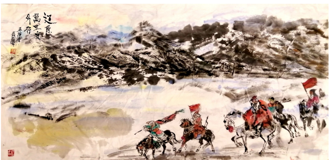
水墨画 辽原万里塞外行 代丽娜

“笑语同来向公子，马头今日向南行。”和同行的人说说笑笑一路走来，今天开始向南走了，那是回家的方向。诗人开心的表达证明此次出使契丹是非常成功的。