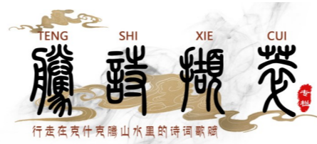
行走在克什克腾山水里的诗撷萃