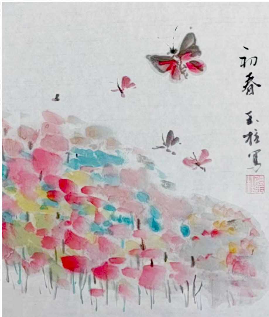
初春水墨画 张玉柱

“纷纷蜂蝶须留意，若到秋来便陨霜。”是整首诗的诗眼。诗人提醒那些在花丛飞舞的蜜蜂蝴蝶要注意了，要珍惜短暂的春天，抓紧时间采蜜。如果秋天一到，这些花就落霜凋零了。“纷纷蜂蝶须留意”用的是拟人的手法，这样就使整首诗变的富有野趣和生动。也更有哲理。这实际上也是高士奇要表达的中心思想。那就是时光易逝，要珍惜当下。