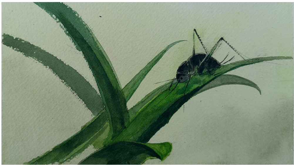
络纬图 水墨画 鹿昭辉