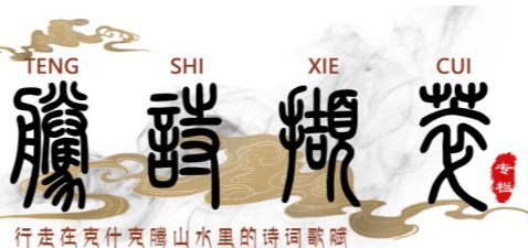
行在克什克腾山水里的诗词歌赋