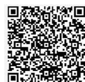
克什克腾融媒 (客户端app)