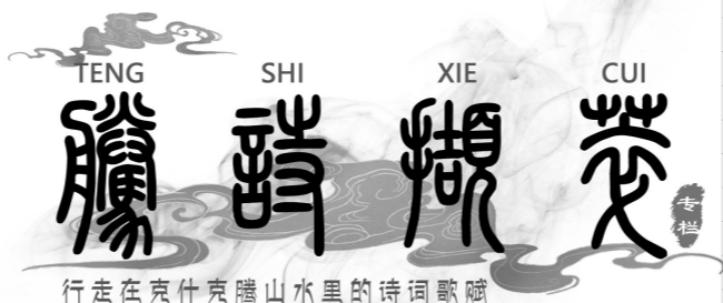
行走在克什克腾山水里的诗词歌赋