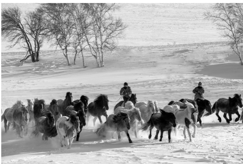
雪野奔马图

人常说“茶靡过后，再无花开”，“春吐茶藜秧”即是春光乍现，原野返青之时。此时，克什克腾旗草原的小草刚刚拱出地面，闻到久违的新鲜青草味道，牲畜也狂躁起来，“三月羊跑断肠”，就是这个季节最贴切的写照。但是诗人描绘的却是万物复苏，万马奔腾，一派生机勃勃的景象。