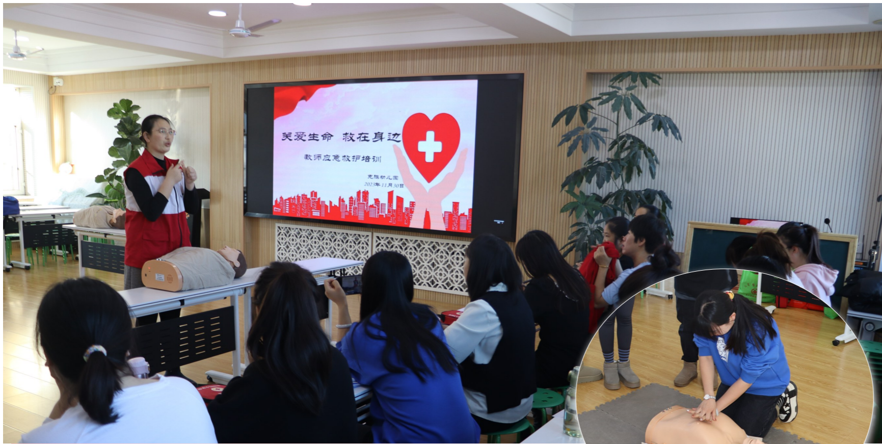
11月30日,旗红十字会到旗幼儿园开展救护员培训活动,37名幼儿园教师参加培训。

截至目前,柳兰社区共开展“视频办”29次,“延时预约”服务47次,“上门服务”648次,“蒙速办”436次。民生无小事,枝叶总关情,柳兰社区针对辖区不同群体,不断地优化服务模式,拓展多样化服务方式。下一步,柳兰社区将继续坚守为民服务初心,及时满足办事居民群众的个性化服务需求,用心用情做好为民服务工作,打造更加人性化、有温度、高效率的社区服务。